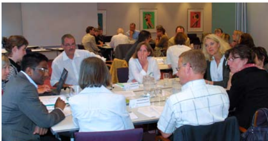
Rådets rolle over for medierne blev diskuteret på fællesudvalgsmøde d. 26.05.08

De tre oplæg var med til at sætte rammen om eftermiddagens diskussioner, hvor deltagerne blev delt i fem grupper, som hver især drøftede, hvilken rolle Rådet ønsker sig og har mulighed for i forhold til medierne.